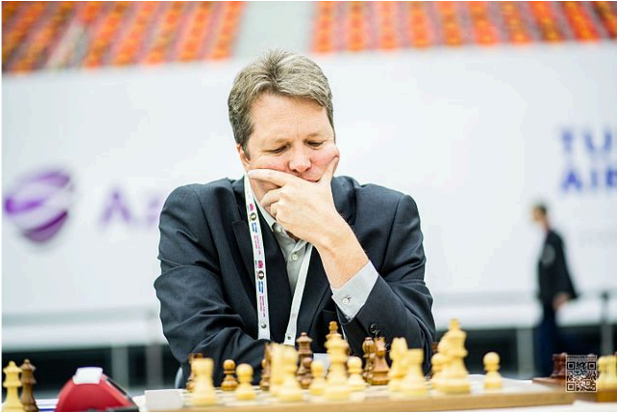
Nigel Short

sociologie, et aucune preuve suggérant que les hommes sont intrinsèquement meilleurs en ingénierie ou en mathématiques, ou physique. Il est profondément embarrassant que les « dirigeants » de la communauté des échecs continuent de s'accrocher à des idées archaïques et non scientifiques qui semblaient chez elles dans les années 1950.