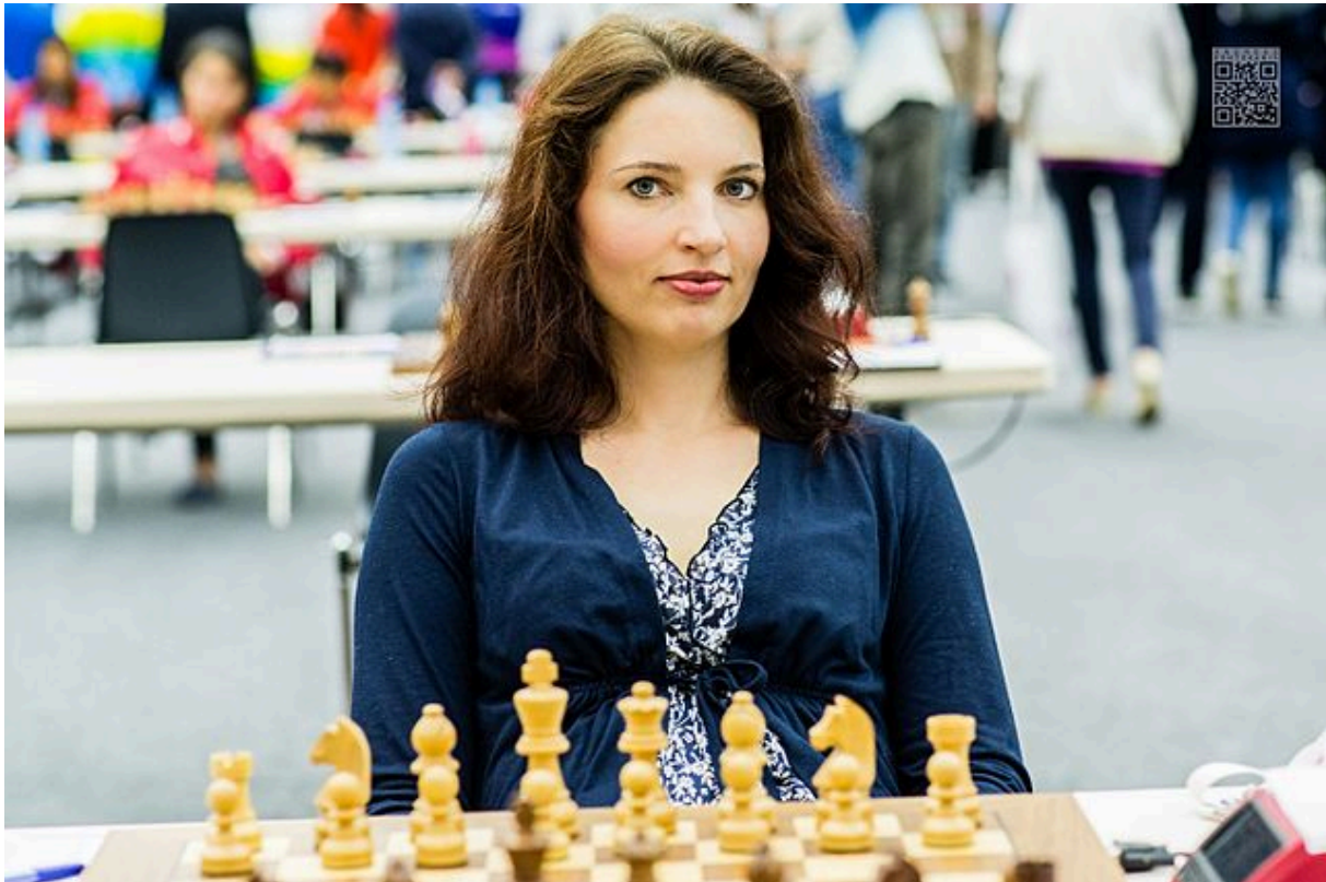
Eva Repkova

Cependant, les femmes n'entendent pas seulement parler de leurs propres lacunes par les internautes anonymes. Ils l'entendent également de la part de professionnels de haut niveau. Eva Repková dirige la commission des échecs féminins à la Fédération internationale des échecs (FIDE), et même elle pense que les femmes sont "naturellement" désavantagées aux échecs, ce qui suggère que les filles sont plus naturellement adaptées à la "composition florale". Comment les filles sont-elles censées être inspirées par une femme qui, de toute évidence, ne croit pas en elles? C'est une inadéquation étonnante entre la profession et la personne, et en dit long sur la profondeur du sentiment anti-femme dans la culture des échecs. Il n'est pas surprenant d'entendre ce genre de chose de la part des hommes; des autres femmes, c'est une trahison totale.